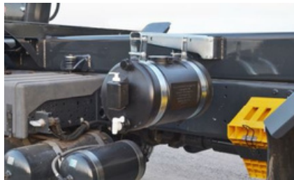
Tanque de agua