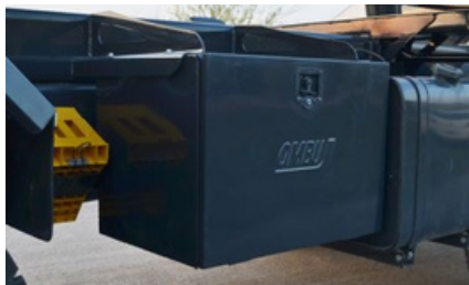
Cajón de herramientas lateral metálico.