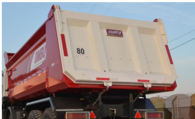
Puerta trasera de apertura simple y cierre automático.